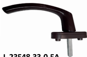
L-23548-33-0-5A Manilla Neptuno F 33mm, Marrón