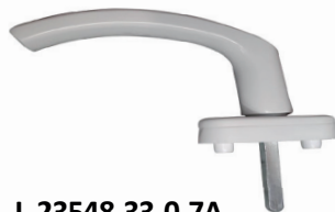
L-23548-33-0-7A Manilla Neptuno F 33mm, Blanca