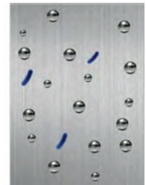
Superficie después de 24 hrs. Muestra la acción de los iones de plata.

El recubrimiento utilizado por manilla antibacterial elimina el crecimiento de microbios en el recubrimiento orgánico. Gracias a una combinación especial de sustancias activas con iones de plata, la reproducción de bacterias y hongos se reduce considerablemente, lo que ayuda a mantener la superficie limpia entre cada ciclo de limpieza durante mucho tiempo.